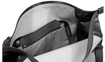
Innentasche im A4-Format

Beidseitig 3M Scotchlite Reflektoren Griff zum Einhängen und Auslösen des Quick-Lock2.1-Systems Selbsttätig schließende QL2.1-Haken in der Größe 16 mm Auswechselbare Hakeneinsätze in den Größen 8, 10 und 12 mm mit Anti-Scratch-Funktion Verschiebbarer und drehbarer Arretierungshaken (15° Schritte) mit Anti-Scratch-Funktion Hakenschiene aus Zwei-Komponenten-Kunststoff mit Anti-Scratch-Funktion Kantenschutz mit Schlitzen für Tragesystem