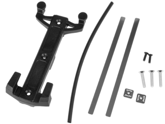
Quick-Lock S Adapterplatte inkl. Befestigungszubehör (im Lieferumfang enthalten)