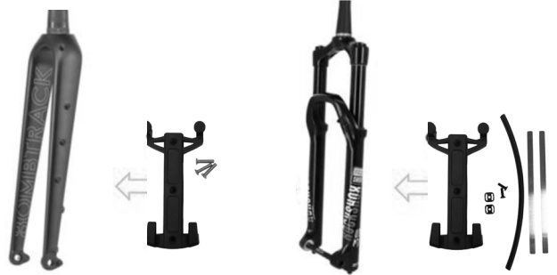
Quick-Lock S Adaptersystem bei Gabeln mit Schraubbefestigung